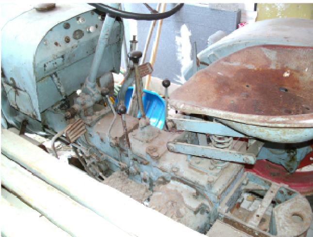
9 Eicher wassergekühlt, Deutz-Motor, 22 PS, ZF-Getriebe, Baujahr 1949, optisch o.K. aber Motor defekt