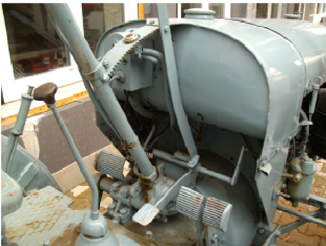
10 Eicher wassergekühlt, Deutz-Motor, 22 PS, Prometheus Getriebe, Baujahr 1939, unrestauriert, stark restaurierungsbedürftig